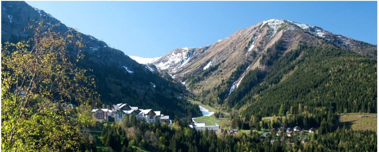
combe de Poutran fin de printemps