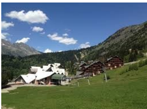
gare départ de Poutran